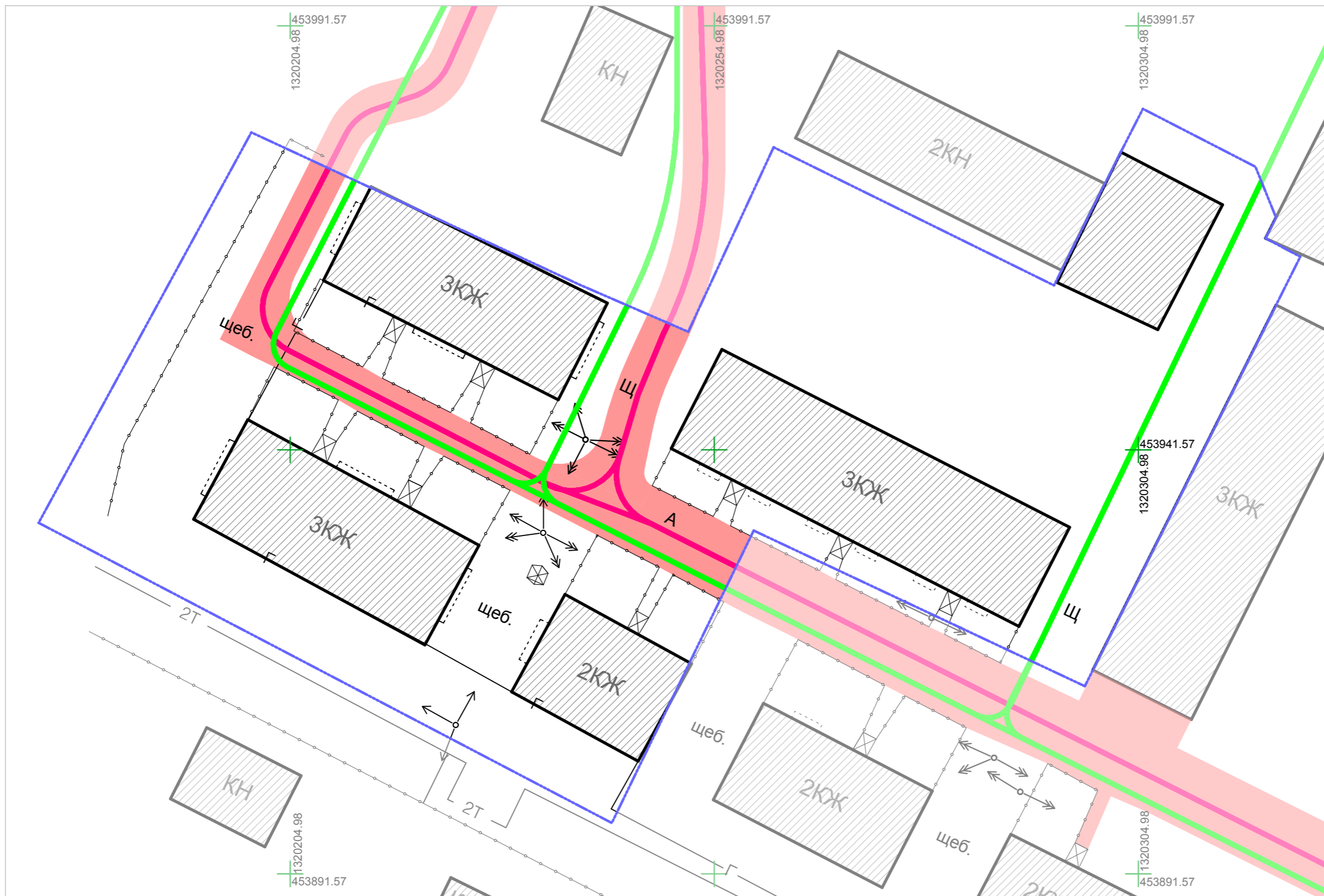
Схема организации улично-дорожной сети